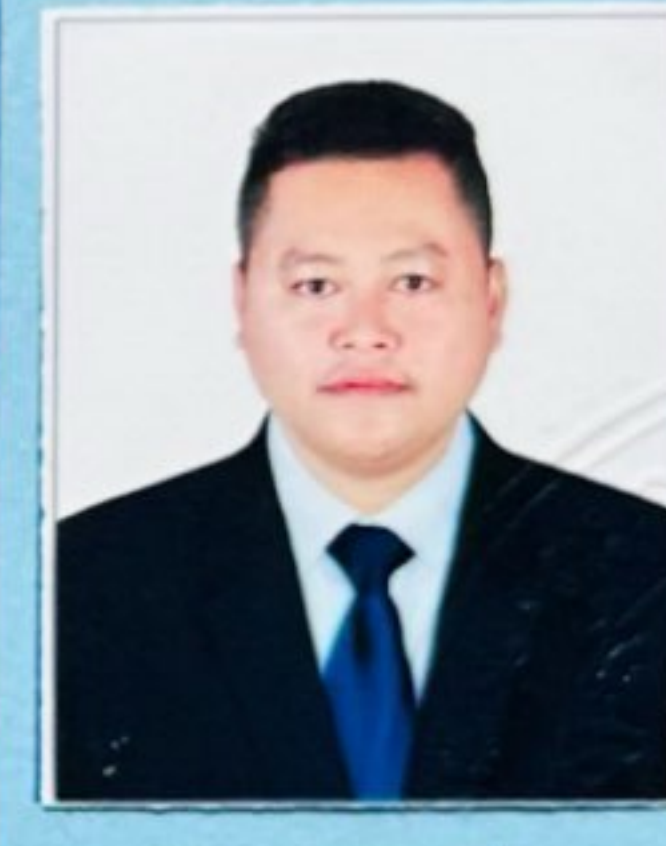
ហត្ថលេខាសាមីខ្លួន