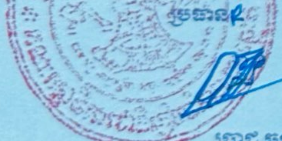
ប្រាជ្ញ ចន្ទ