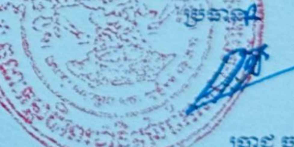
ប្រាជ្ញ ចន្ទ