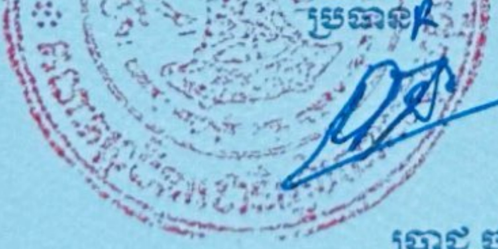
ប្រាជ្ញ ចន្ទ