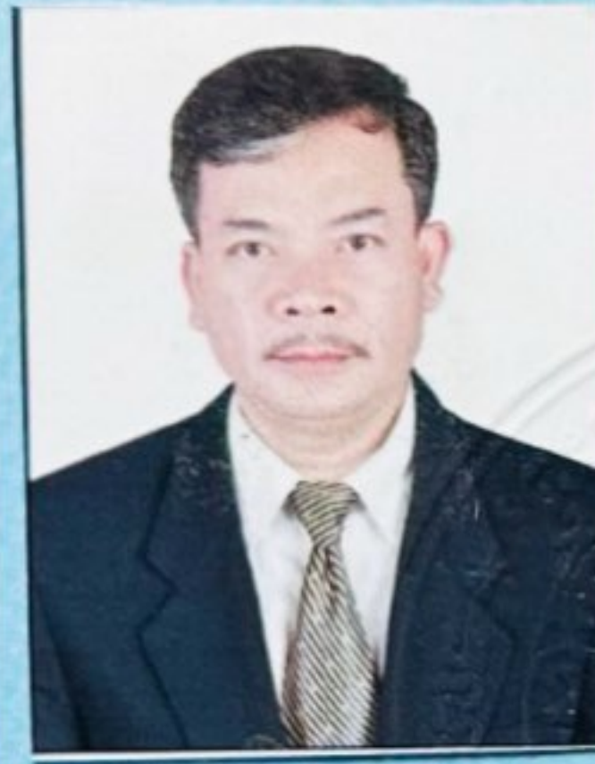
ហត្ថលេខាសាមីខ្លួន