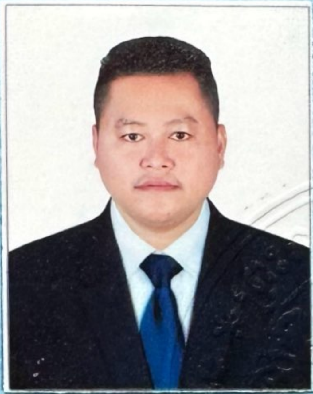
ហត្ថលេខាសាមីខ្លួន