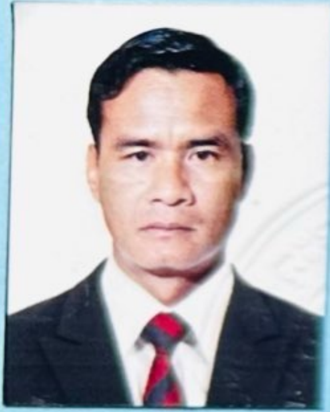
ហត្ថលេខាសាមីខ្លួន