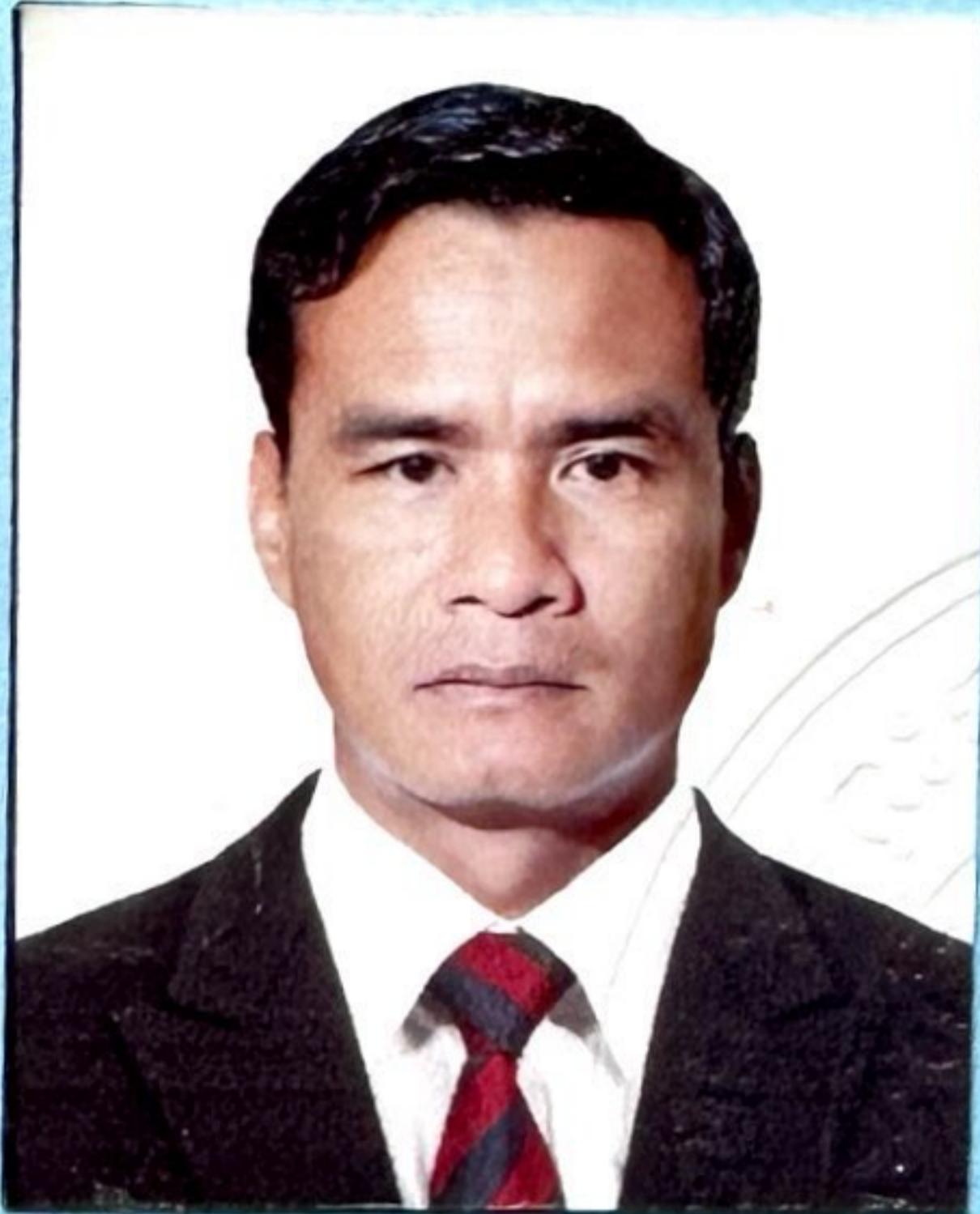
ហត្ថលេខាសាមីខ្លួន